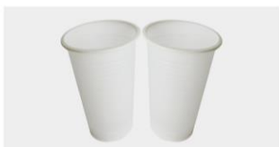
COPO DESCARTÁVEL 350 ML

REF | 3108010007 EAN | 6063000040531 COR | Transparente BOX | 3.000 Un.