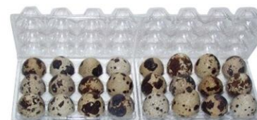
ET 2X12B CODORNIZES C/ TAMPA

MED. EXT | 205x152x69 mm REF | 310805012 EAN | 6063000041811 BOX | 100 Un. CAPACIDADE | 24 Ovos CALIBRE | 53g - 75g