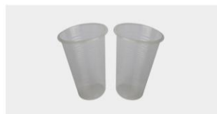
COPO DESCARTÁVEL 200 ML

REF | 3108010002 EAN | 6063000040685 COR | Branco BOX | 3.000 Un.