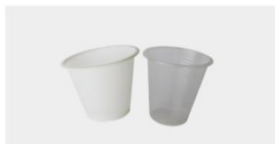
COPO DESCARTÁVEL 50 ML

Suite à son partenariat avec la Zone économique spéciale de Luanda en Angola, la Chambre offre une vaste sélection d'emballages personnalisables en fonction des produits :