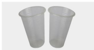
COPO DESCARTÁVEL 350 ML

REF | 3108010008 EAN | 6063000040692 COR | Branco BOX | 2.500 Un.