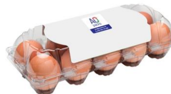
ET 10 - C/ TAMPA

MED. EXT | 105x52,5x71 mm REF | 310805009 EAN | 6063000041439 BOX | 100 Un. CAPACIDADE | 12 Ovos CALIBRE | 53g - 75g