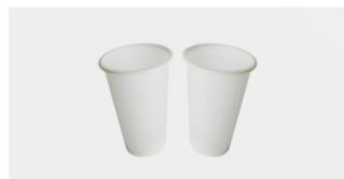
COPO DESCARTÁVEL ML

REF | 3108010004 EAN | 6063000040661 COR | Transparente e Branco BOX | 6.000 Un.