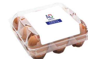
ET 9 - C/ TAMPA

MED. EXT | 220x105x71 mm REF | 310805008 EAN | 6063000040716 BOX | 100 Un. CAPACIDADE | 10 Ovos CALIBRE | 53g - 75g