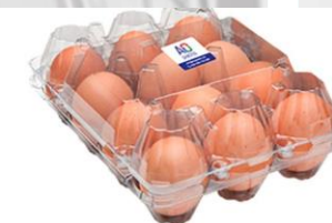
ET 12 - C/ TAMPA

MED. EXT | 205x152x69 mm REF | 310805012 EAN | 6063000041811 BOX | 100 Un. CAPACIDADE | 24 Ovos CALIBRE | 53g - 75g